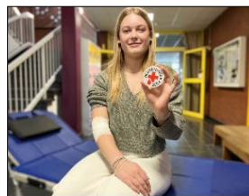
Junge Erstspenderin, die nach ihrer Blutspende die Information über ihre Blutgruppe erhält

Für alle DRK-Blutspendeterminale ist eine Terminreservierung erforderlich, die online https://www.blutspende-nordost.de/blutspendetermine/ oder telefonisch über die kostenlose Hotline 0800 / 11 949 11 oder über den Digitalen Spenderservice www.spenderservice.net erfolgen kann.