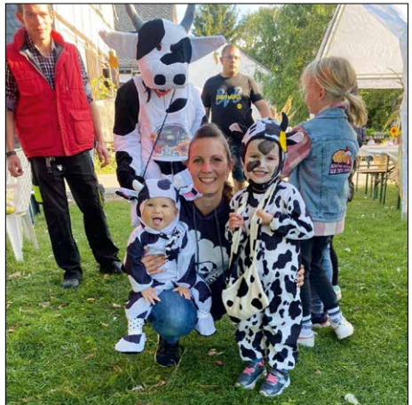
Familie Vogel mit Maskottchen „Elsa die Kuh“ (im Hintergrund)