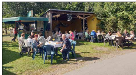
Auch für das leibliche Wohl war gesorgt, mit Fleisch und Wurst vom Grill sowie Kaffee und hausgebackenen Kuchen

Videobeitrag: https://youtu.be/ iXqnpqGki1I