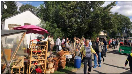
Verkaufsstände ländlicher Produkte